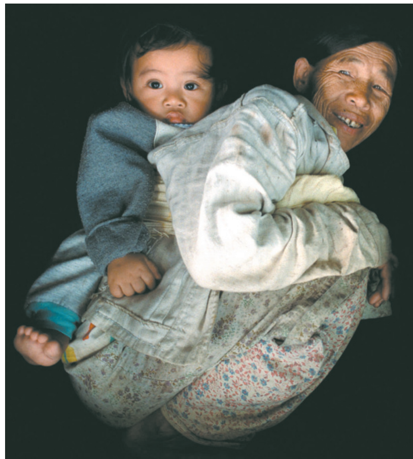
Una indígena ifugao carga a un infante en la isla de Luzón.